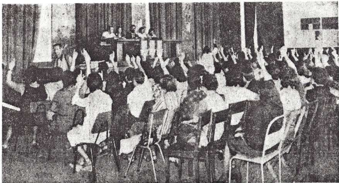
Plenário de trabalhadores dos têxteis do Sul: defesa da unidade e reestruturação da central sindical única